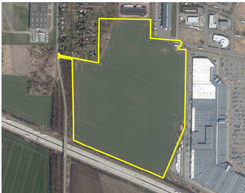
Luftbild des Plangebietes (Stand 2018)

DOP 12/2018 © LvermGeo LSA Az.: 18-6007867/2011